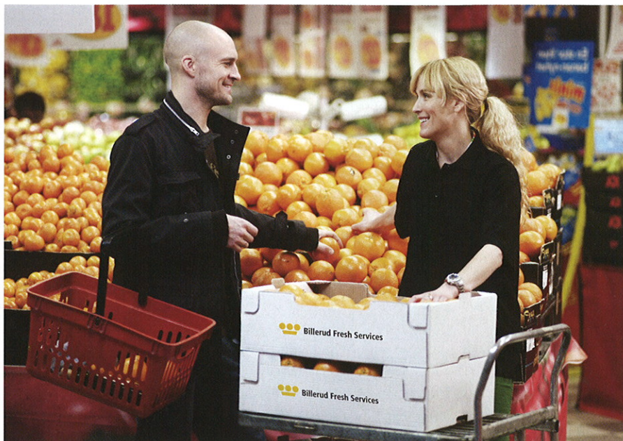
Att arbeta på rätt sätt, från packstation till slutkund, ger vinster i form av minskat svinn.